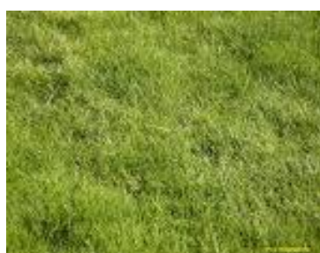
char fű, gyp