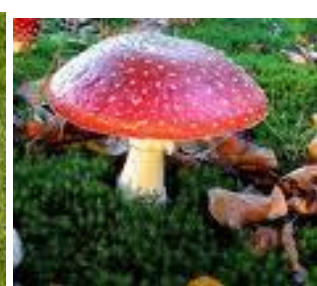
buraca, huhur gomba