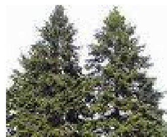
braduno kaszt fenyőfa