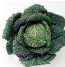
kreco shax kelkáposzta