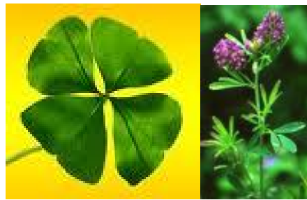
detelina lóhere, lucerna