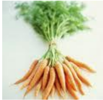
galbeno ropaj sárgarépa