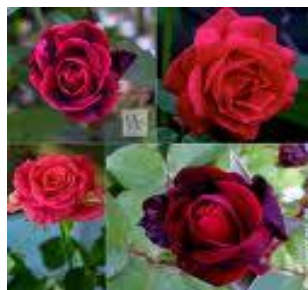
rozha, rozhica rózsa