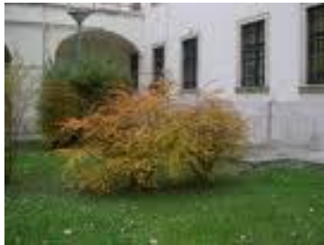
bozuli bokor, bozót